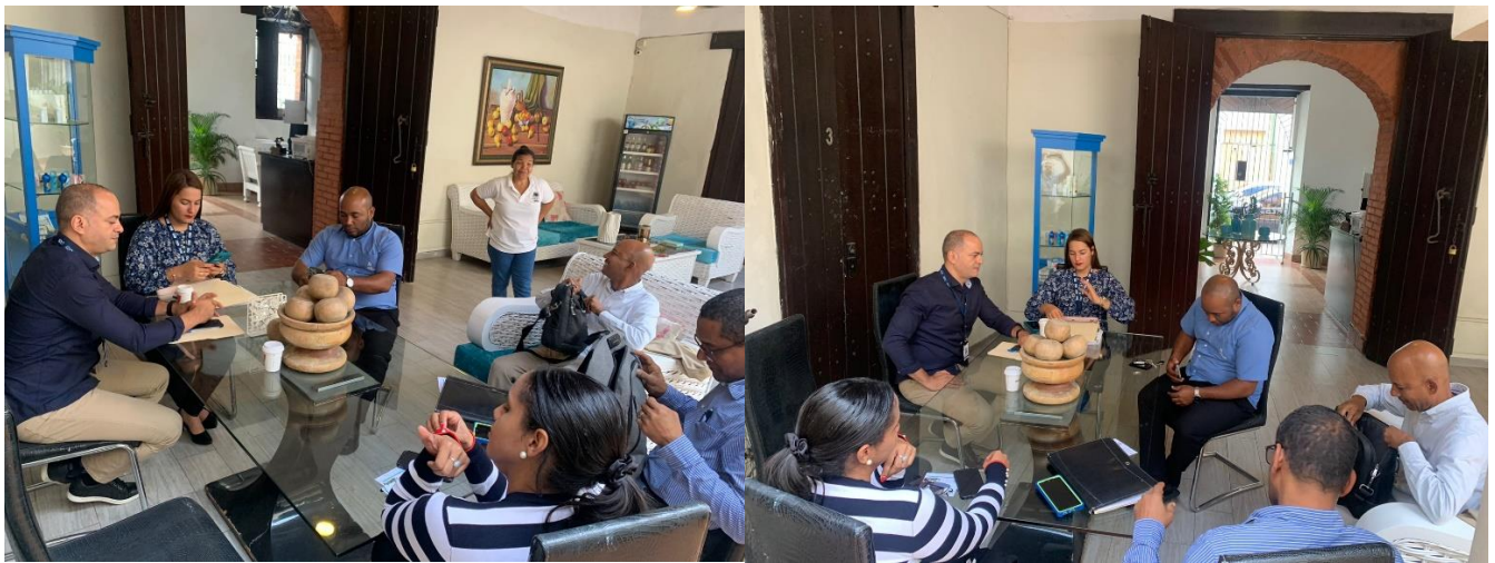
Imágenes de participantes