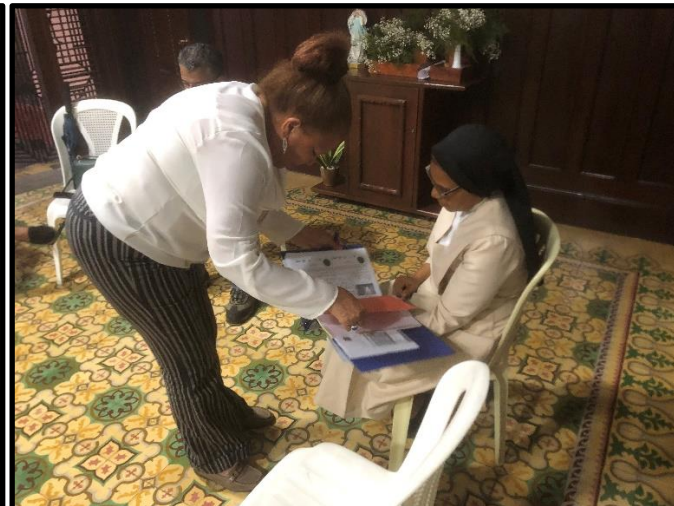
Foto de la reunión del ECOP Las Damas